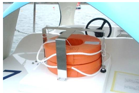
ライフリング(オプション)