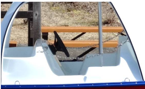
サイドチェーン(標準装備)