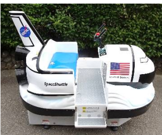
ひこうくん・シャトルくん