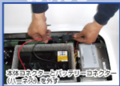
本体コネクターとバッテリーコネクター (小三ネズ) を外す