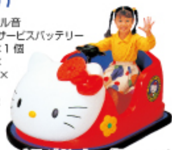
ハローキティ等といっしょ (BT40011)

© 1976, 2011 SANRIO CO., LTD. APPROVAL No. G521165