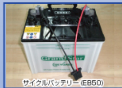
サイクルバッテリー (EB50)