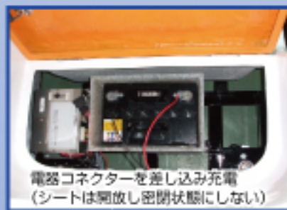
電器コネクターを差し込み充電 (シートは開放し密閉状態にしない)

充電はコネクター式であり、誤接続等の恐れが無く安心 (弊社充電器ご使用の場合) *搭載のサイクルバッテリーは、必ず専用充電器での充電をお願い致します