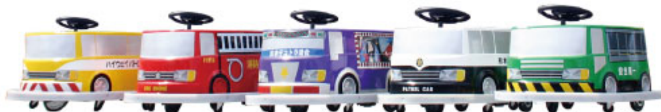
ハイウェイバトカー