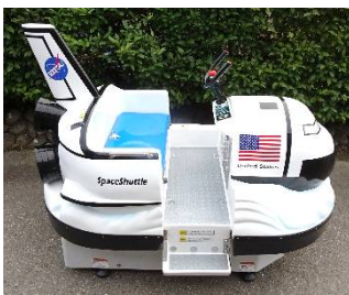
ひこうきくん・シャトルくん