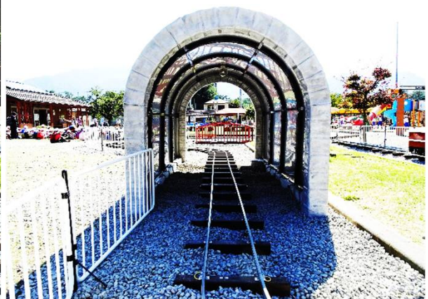
トンネル内光と音